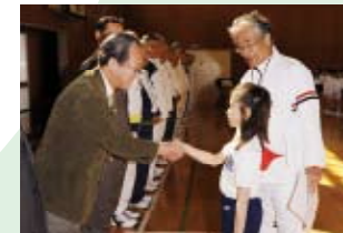
♡5 修了証書授与では、しっかり相手の目を見て「ありがとうございます」