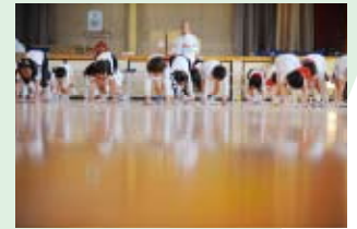
♡4 マナーキッズ教室が終わると全員で後片付けと掃除

プログラムは、子どもの体力・運動能力の低下に歯止めをかける＜体育＞、挨拶・礼儀作法の基本的マナーとスポーツマンシップを習得させる＜徳育＞、運動で知性を育む＜知育＞を考慮して組まれており、既に実施した全国各地の幼稚園・小学校から高い評価を得ています。