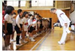
♡1 姿勢を正しく、相手の目を見ながら元気づけ大きな声で自己紹介

認定NPO法人マナーキッズ®プロジェクトの原点は、平成17年4月から開始した(財)日本テニス協会マナーキッズテニスプロジェクトです。各地の小学校などの反応は極めてよく、「挨拶をする子が増えた」「子どもをプラス方向に変える力を持っている」「いじめを減らす効果が期待できそう」といった趣旨の報告が数多く寄せられています。さらに、幼児期の運動体験は、身体的な発育・発達の面だけではなく、知能の発達にも資するとの研究報告が本プロジェクトにより、なされています。以上のことから、テニスに限らずスポーツの種目を超え、そしてスポーツ以外の子どもも活動団体などとも連携・協力しながら広く活動を展開していきたいとして平成19年6月に本法人を設立いたしました。平成22年3月に国税庁より、税の優遇措置が受けられる認定NPO法人に認定されたのを契機に、平成22年4月より、マナーキッズテニスプロジェクトも、本法人が主催しております。