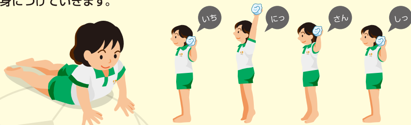
アザラシ歩き(手で歩く)

マナーキッズ®体幹遊びとは、 様々な「遊び」を通して、正しい姿勢、お辞儀・挨拶を習得できるプログラムです。 タオルや新聞紙を使用したり、用具を使わない「遊び」を通して、サッカーは もちろん日常生活でも重要な「体幹」を鍛えます。 正しい姿勢、お辞儀・挨拶を「体幹遊び」の始めと終わりに、繰り返し行い、 身につけていきます。