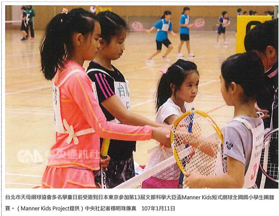
台北市天母網球協會多名學童日前受邀到日本東京參加第13屆文部科學大臣盃Manner Kids短式網球全國國小學生團體賽。 107年1月11日

發稿時間：2018/01/11 16:13 最新更新：2018/01/11 16:37 字級： A- A+