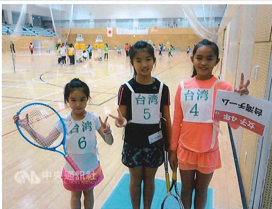
台北市天母網球協會多名學童日前應邀赴日，參加迷你網球交流賽，台灣四年級女子組成功摘下冠軍。107年1月11日